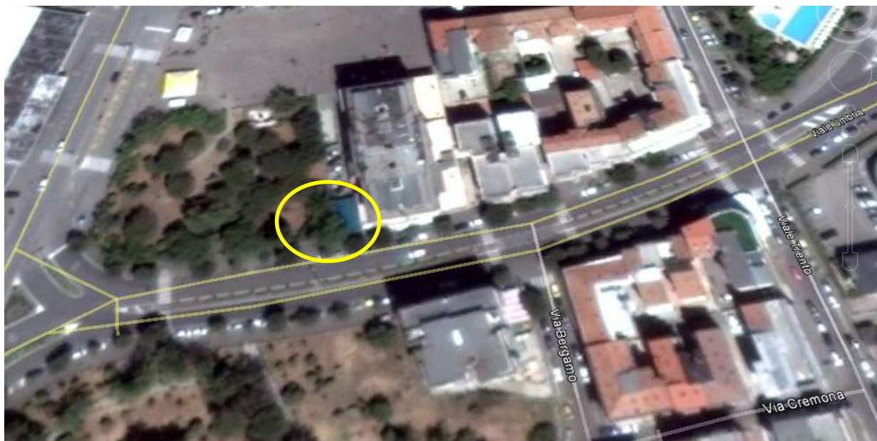
Immagine da satellite